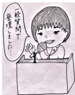
イラスト協力/しいちゃん

答弁/ホームページや広報、やちよ情報メール（登録制）、観光ガイドアプリ「ココシルやちよ」への掲載、新川やバラ園を撮影した観光ポスターの掲出、動画配信サイトの公開等。また、テレビドラマ、CM、映画等のロケ地に（昨年度は54j件の撮影実績あり）八千代市を積極的に活用してもらえるよう県フィルムコミッションとの連携強化。そして、口コミやSNS発信による新たな仕組みも検討していく。 これ言いたい！/情報は鮮度が命！タイムリーで確実な情報提供があつてこそ、シティーセールスの“目的”が達成されると思います。取材能力、加工発信能力を磨く必要があるのではないのでしょうか？ そして、市民の誇りと郷土愛を伝えるコンテンツもピックアップし、全庁挙げての取り組みで市民と共に来訪者をお迎えする姿勢を示す必要があります。また、市が関係するイベントにイメージキャラクターの“やっち”の姿が見えないなど、マネジメント機能にも疑問を感じています。市外へのPRと共に、市民の期待、特に子ども達の期待を裏切らないようにしたいものです。